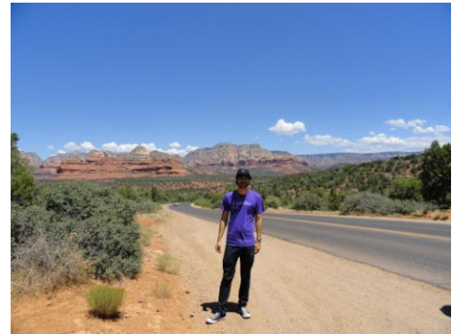
Auf Reisen in Sedona, Arizona

relativ wenig wusste und wurde positiv überrascht. Downtown, der Stadtkern, wirkt teils total überfüllt und hektisch.