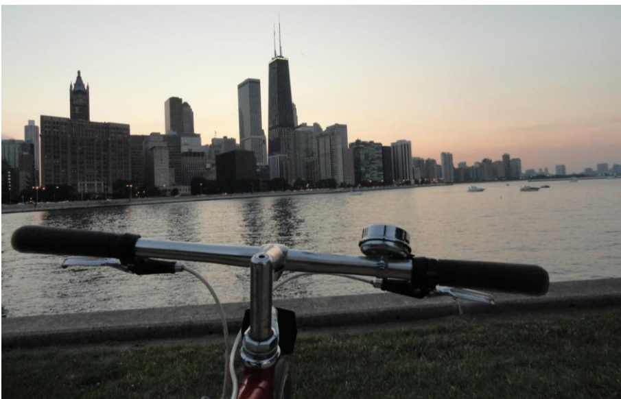
Mit dem Bike durch Downtown Chicago