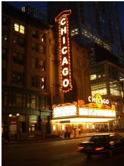
Berühmtes Chicago Theater

Weiterhin arbeite ich beim Jewish Council on Urban Affairs (JCUA) und bin inzwischen voll und ganz eingegliedert. Meine Englisch-Kenntnisse haben sich während der zweiten Hälfte meines Freiwilligendienstes natürlich nochmal deutlich verbessert. Ein Akzent, der aber durchaus positiv aufgenommen wird, ist zwar vorhanden, doch inzwischen spreche ich ein