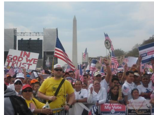
Demonstration in Washington D.C.

Ereignis statt. Dort traf ich mich mit Kollegen vom JCUA. Politiker und Aktivistin sprachen. Die Veranstaltung wurde mit einem großen Marsch abgeschlossen. Nach dem körperlich sehr anstrengenden Tag ging es mit dem Bus abends wieder los. Weitere 16 Stunden Fahrt brachten mich zurück nach Chicago. Völlig fertig, jedoch überwältigt von dem wichtigen Erlebnis war ich am nächsten Morgen wieder in Chicago. Washington D.C., eine wirklich coole Stadt, konnte ich während des dritten ASF-Seminars im Mai erneut und ausgiebiger erleben. Diesmal war die Anreise jedoch angenehmer und mit dem Flugzeug. Die Stadt soll sich angeblich nach jedem Regierungswechsel stark verändern und hat sich seit Obama anscheinend in eine gute Richtung entwickelt.