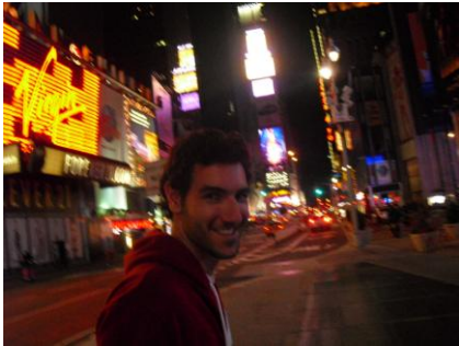
Unterwegs in Manhattan

Ende März reiste ich während dem größten jüdischen Fest Passover/Pesach für ungefähr zwei Wochen nach New York. New York ist eine Weltstadt, die bei mir alle Erwartungen erfüllt hat und jeden fesselt. Das Abbild einer Metropole, in der alles möglich ist. New York ist dynamisch, chaotisch, dreckig und doch schön zugleich.