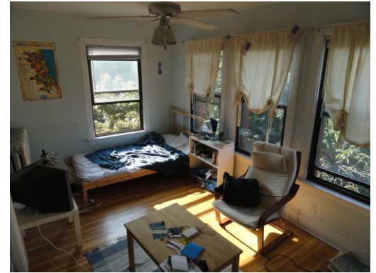
Wohnung in Lakeview, Chicago

relativ gutes amerikanisches Englisch. Aufgrund der zu hohen Miete und einer komplizierten Regelung meiner Wohnsituation ging ich davon aus, dass ich gegen Ende Mai hätte umziehen müssen. Die Suche nach einer Wohnung wäre durch das begrenzte Budget erneut sehr schwierig