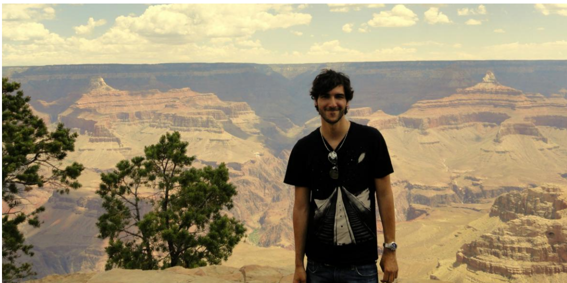
Überwältigend: Grand Canyon South Rim

Nach einer Gesamtanzahl von insgesamt 130 Stunden innerhalb von 15 Tagen in Zügen der amerikanischen Bahngesellschaft Amtrak war ich nach diesem Urlaub eher kaputt als erholt. Aber es war jede einzelne Minute wert.