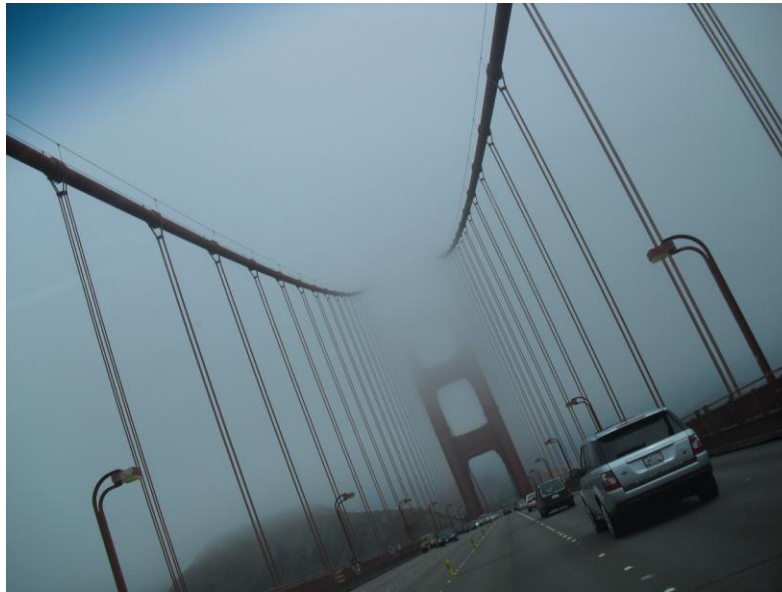
Die riesige Golden Gate Bridge im Nebel San Franciscos

Mein nächstes Ziel war San Francisco. Nachdem ich mich dort mit einer Freundin aus Chicago traf, die zur gleichen Zeit in California war, fuhren wir mit einem Mietwagen durch die Bucht San Franciscos und