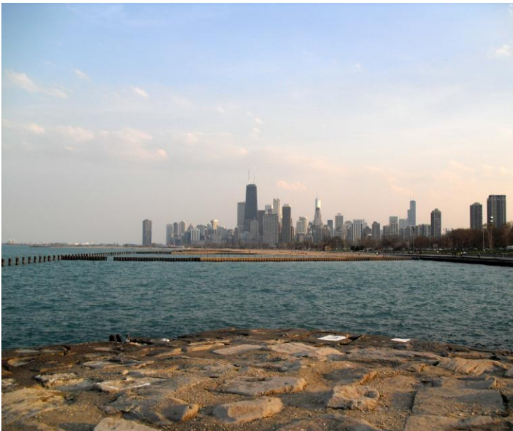
Skyline Chicagos von der North Side aus