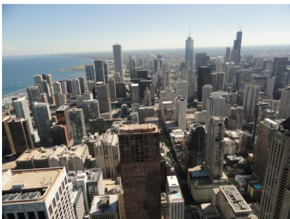
Aussicht aus der 96. Etage des John Hancock Centers

Region und liegt beispielsweise in jeder Synagoge in Chicago und den Vororten aus. Diese Ausgabe enthielt einen nennenswerten Artikel über die Arbeit des JCUA und den Einsatz für neue US-Einwanderungsgesetze. Desweiteren habe ich immer versucht, mir gegebene Möglichkeiten zu nutzen und andere Arbeiten für Kollegen auszuführen bzw. einen Einblick in jegliche Bereiche zu bekommen, wann immer es möglich war. An regelmäßigen wichtigen Mitarbeiter-Meetings oder Konferenzen nahm ich als Vollzeit-Mitarbeiter ohnehin mehrmals die Woche teil. Besonders die Arbeit des JCUA für das Durchsetzen einer neuen Immigration Reform , d.h. neuer Einwanderungsgesetze, weckte bei mir großes Interesse und empfinde ich als sehr wichtig. „Diversity“, die Verschiedenheit und Multikulturalität, ist für mich ein sehr positives Merkmal der USA. Natürlich habe ich auch aufgrund meines eigenen Migrationshintergrunds Interesse an diesem Thema. Nachdem der südwestliche Bundesstaat Arizona ein diskriminierendes Gesetz verabschiedet hatte, das Immigranten, insbesondere Latinos, extrem benachteiligt, hat das JCUA reagiert und einen Schwerpunkt auf das ohnehin wichtige Thema gesetzt. Jüdische Prinzipien, wie z.B. „Tikkum Olan“ (hebräisch, zu dt.: Reparatur der Welt, Weltverbesserung) sind Teil der Philosophie des JCUA und Grund für das Engagement. Deshalb arbeitet das JCUA auch als jüdische Organisation mit etlichen anderen