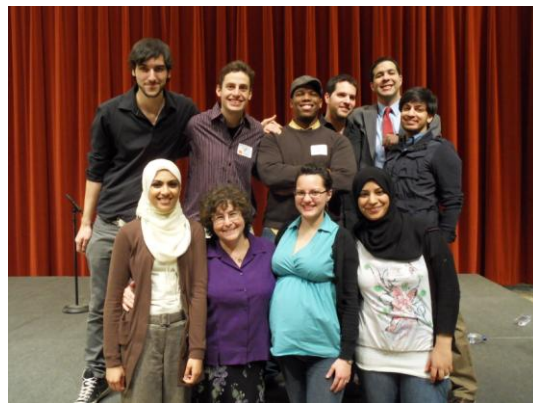
Planungskomitee von Café Finjan

Nach mehreren Monaten der Planung und Finanzierung durch das JCUA und verschiedene Sponsoren zog die Veranstaltung im Februar in der Loyola University of Chicago ungefähr 250 muslimische und jüdische Gäste verschiedener