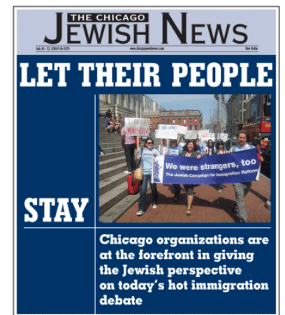
Ausgabe der Chicago Jewish News

News geschafft. Das Foto entstand bei einem Protest in Washington D.C. Die Chicago Jewish News ist eine respektable lokale Zeitung für die jüdische Gemeinde in der Chicago-